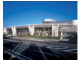
ビッグパレットふくしま