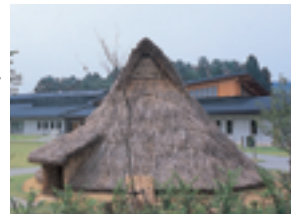
まほろん(県文化財センター白河館)

あぶくま 阿武隈川の源流がある県南地域は、東北の玄関口として古くから栄え、たくさんの文化財があります。また、工場の進出もさかんです。