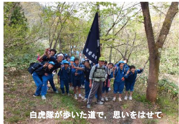
白虎隊が歩いた道で、思いをはせて