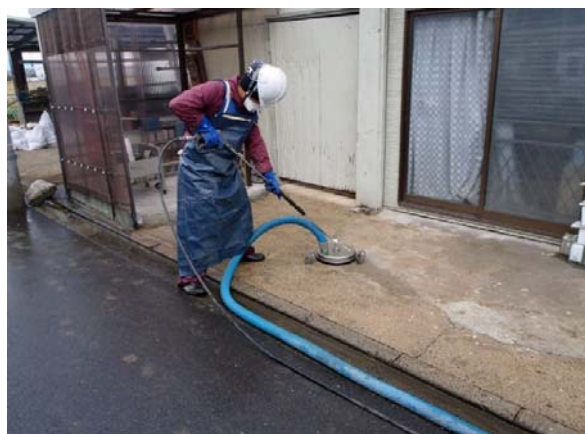
吸引型高圧洗浄によるコンクリートたたき等の除染作業