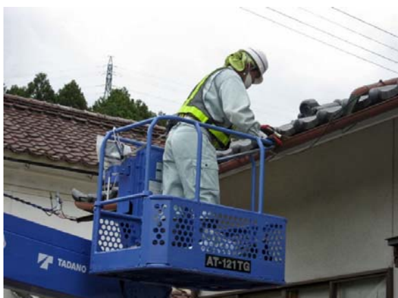
雨樋(横樋の堆積物の除去・拭き取り)の除染作業