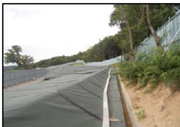
郡山市日和田町高倉地内の 仮置場