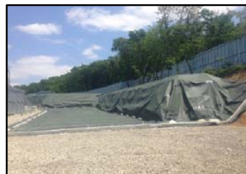
郡山市日和田町高倉地内の 仮置場