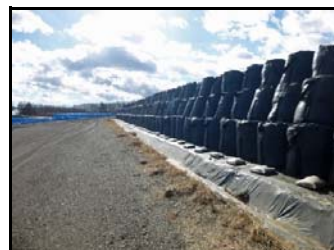
仮置場での保管の様子