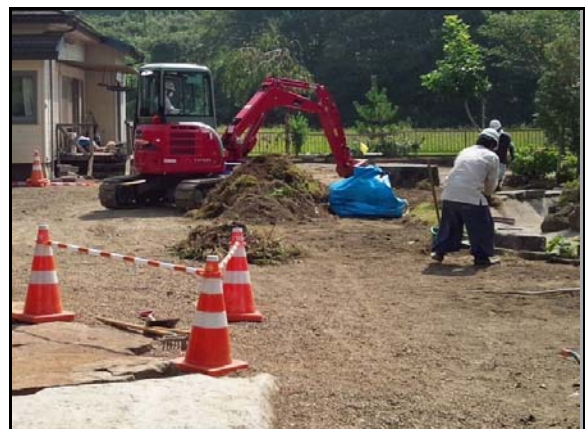
住宅敷地内の除染作業