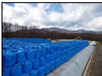
仮置場造成の様子