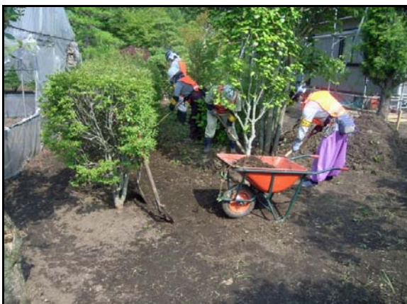
汚染土壌剥ぎ取り作業