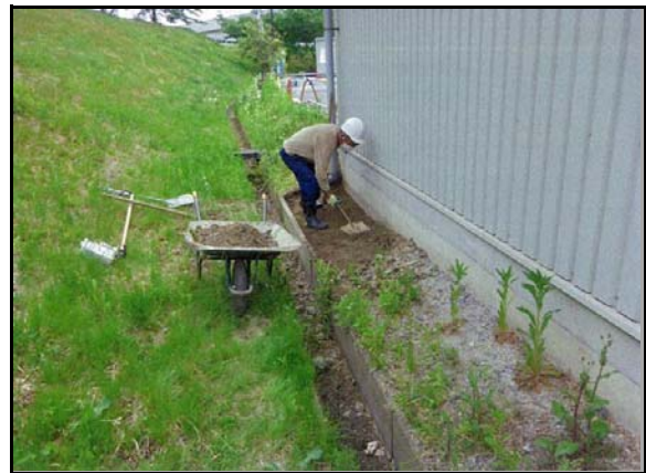
除染(表土剥ぎ取り)