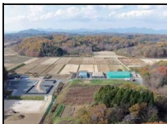
除去土壌の格納状況