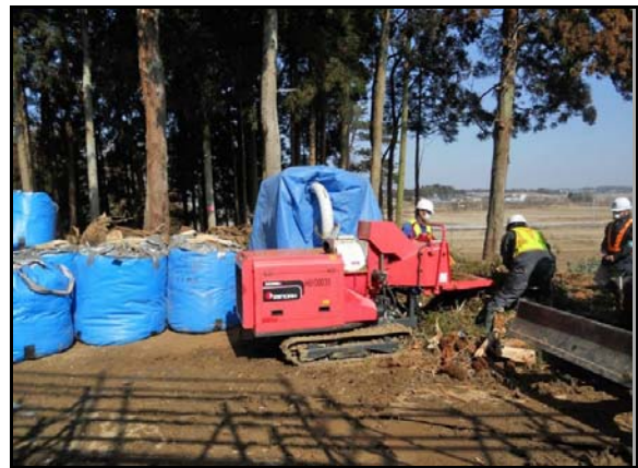
枝打ち後の破碎及び袋詰め