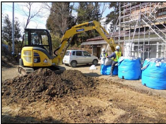
地表面の除染及び汚染土の袋詰め