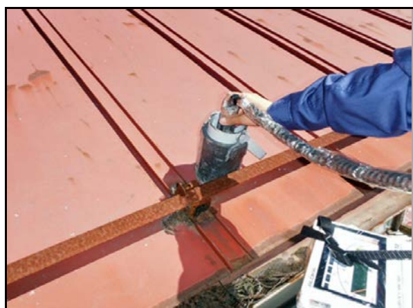
屋根の表面線量率測定