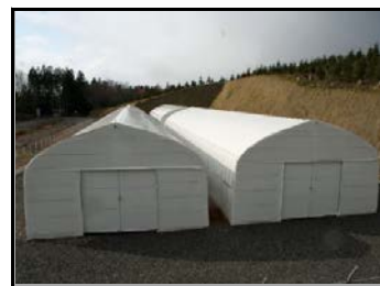
仮置場（裏側から撮影）