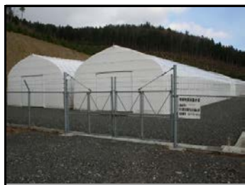
仮置場（入り口側から撮影）