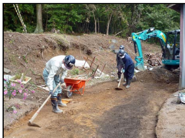
住宅周りの表土除去