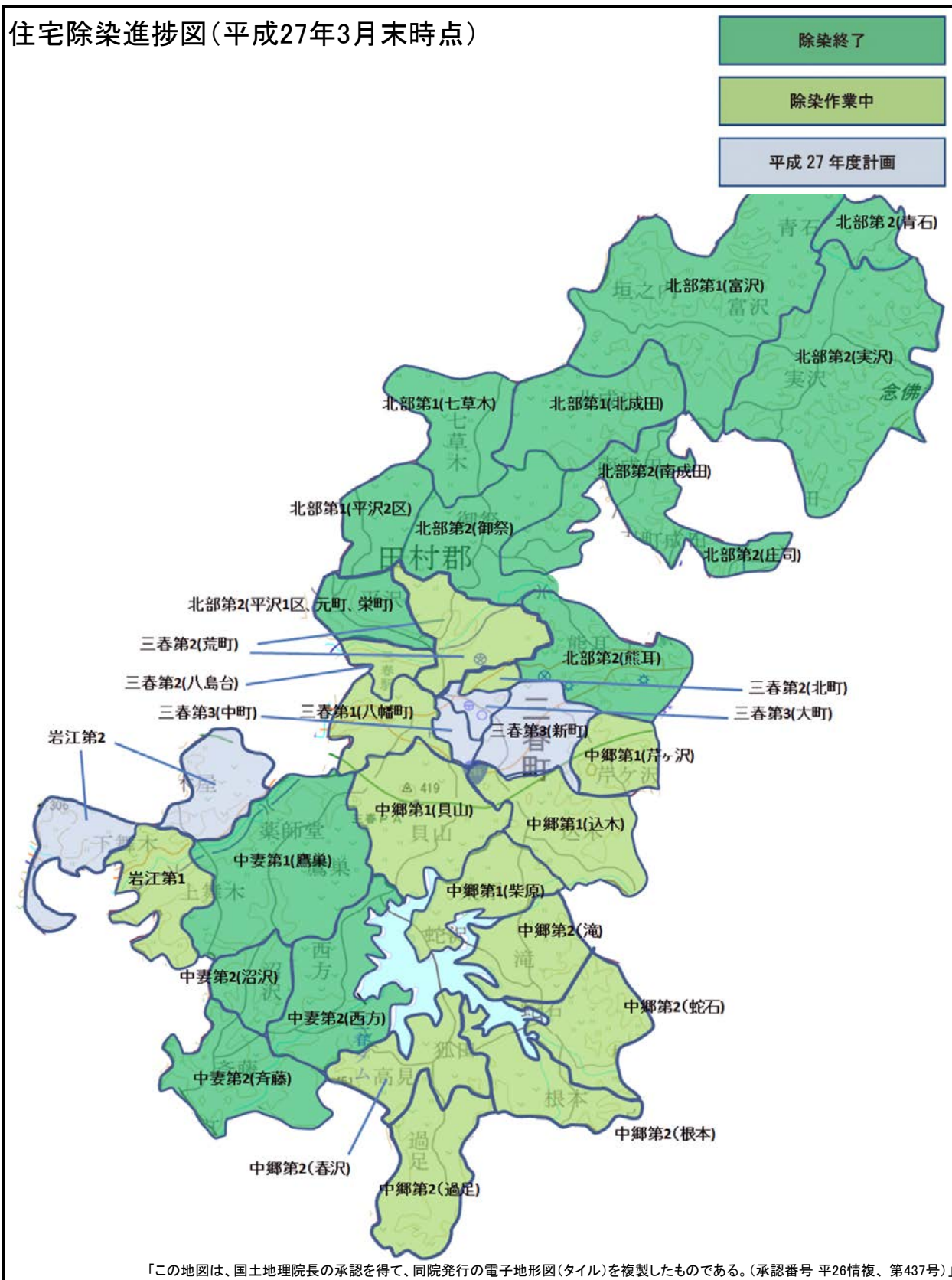
住宅除染進捗図(平成27年3月末時点)