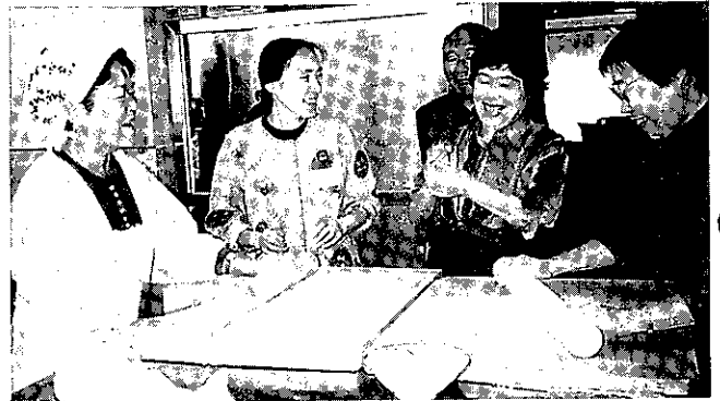
和やかな雰囲気の中、おいしいそばができました

11月1日から3日にかけて南会津地方グリーン・ツーリズム推進協議会主催によるモニターツアーを実施しました。8月には田島町と下郷町をメインエリアにツアーを実施しましたが、今回は館岩村、南郷村、檜枝岐村をメインエリアに、首都圏より29歳から65歳までの男女14人が参加し、リース作り、トマトの収穫、マルメロ酒作り、そば打ちなどを行いました。