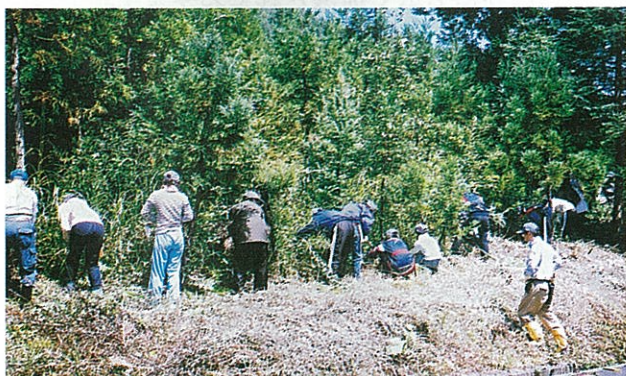
下草刈りなどの体験で、森林を学びました

残暑の中、みんなで汗だくになりながらの林業作業体験となりましたが、閉講式では43名の生徒の代表から「森林を守る仕事がかんにも厳しいものであることと、森林の大切さがよくわかった」という感想が述べられました。(森林林業部)