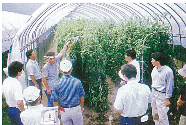
新しい栽培方法の説明を受ける栽培予定者