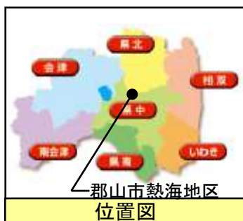
郡山市熱海地区 位置図