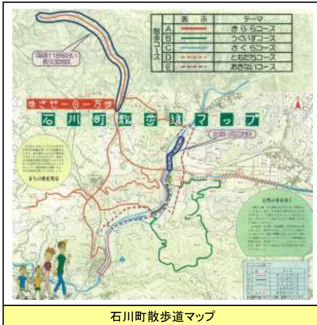
石川町散歩道マップ