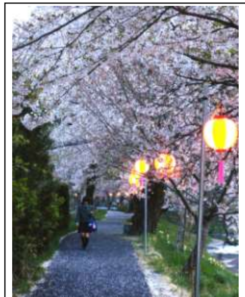
提灯が夜の桜並木を引き立てます。