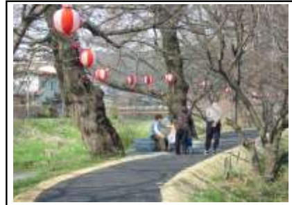
ベンチで楽しく談笑