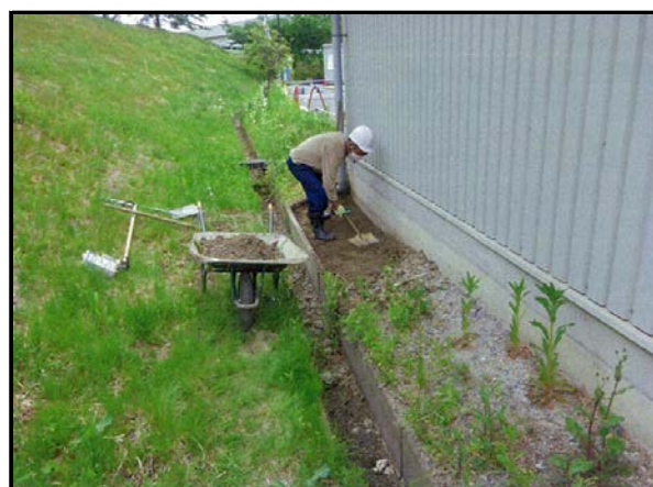
除染(表土剥ぎ取り)