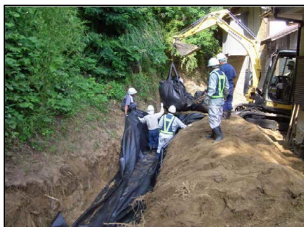
フレコン埋設作業