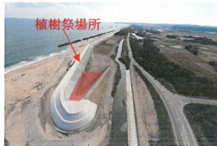
< 会場地図 >