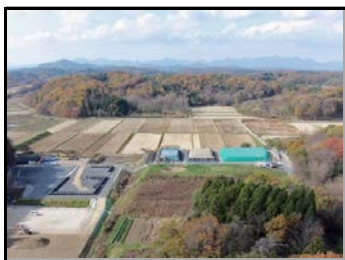
除去土壌の格納状況