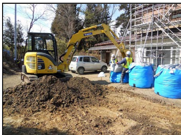
地表面の除染及び汚染土の袋詰め