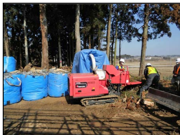
枝打ち後の破碎及び袋詰め