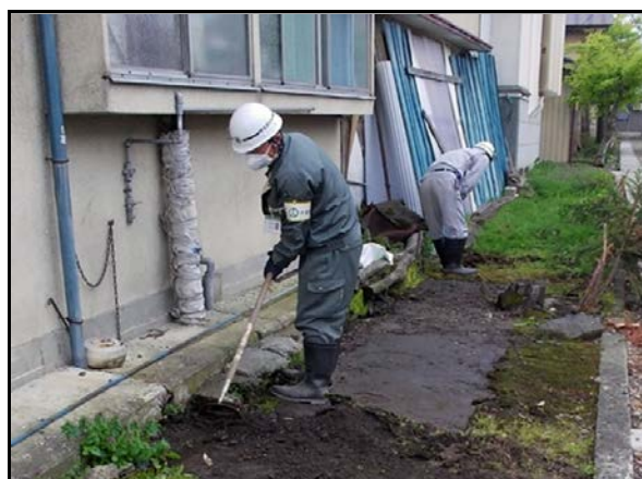
土壌剥ぎ取り作業