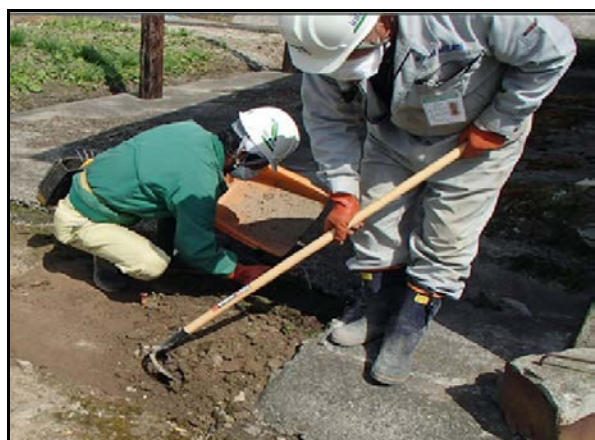
土壌剥ぎ取り作業