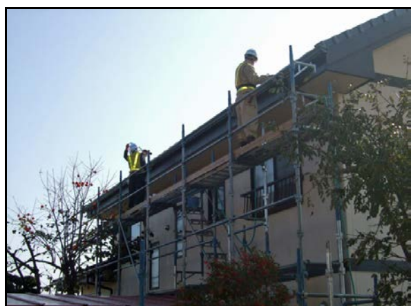
住宅除染実施状況