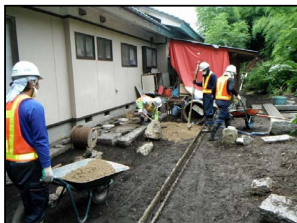
住宅除染実施状況