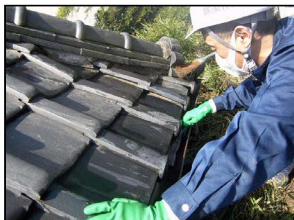
屋根拭き取り状況