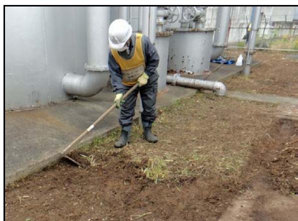
表土剥ぎ取り状況