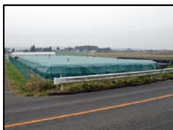
根岸熊ノ前仮置場