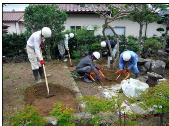
除染作業(表土除去作業)