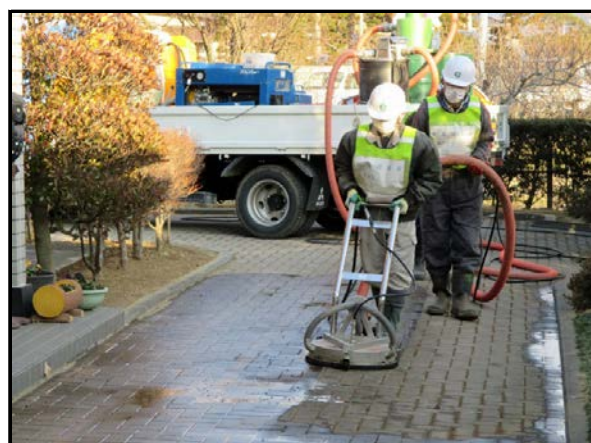
回収型高圧洗浄機による作業