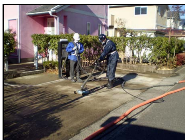
コンクリート洗浄作業