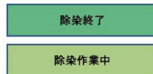
住宅除染進捗図(平成27年12月末時点)