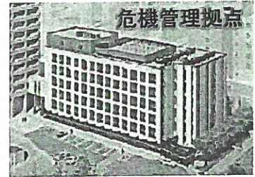
※北庁舎の2階、3階に危機管理拠点を設置