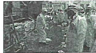
廃炉に向けた安全監視