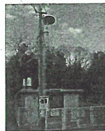
モニタリングポスト