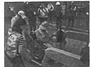
避難行動要支援者避難訓練