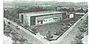
楢葉原子力災害対策センター （楢葉オフサイトセンター）