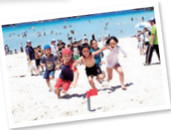
▼ 蛤浜海水浴場 (新上五島町)

島の数が日本一多い長崎県には、極上のビーチがたくさんあります。中でも五島列島の蛤浜海水浴場は、白い砂浜と澄みきった遠浅の海が印象的! ビーチハウスやシャワーも完備され、近くにはキャンプやバーベキューを楽しめる「有川青少年旅行村」もあります。