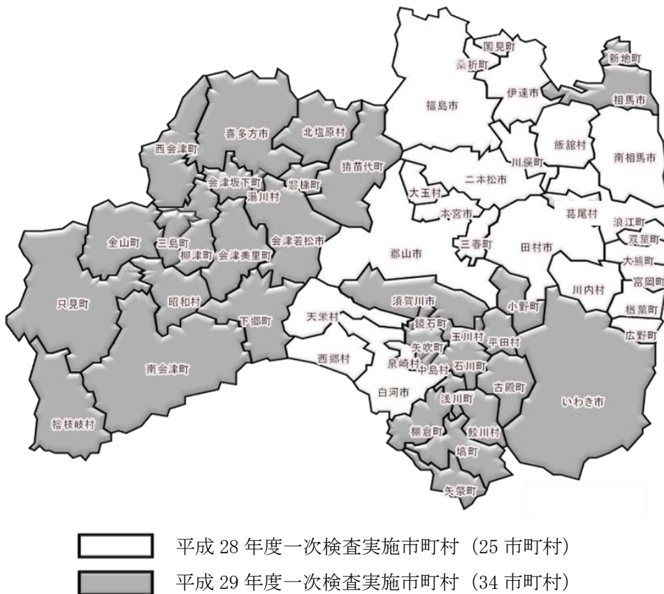
図 2. 実施対象年度別市町村