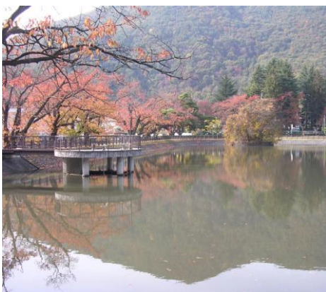
じゅうろく沼(福島市)