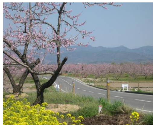
ピーチロード(桑折町)