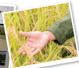
今年の新米も自信を持っておすすめできるいい出来