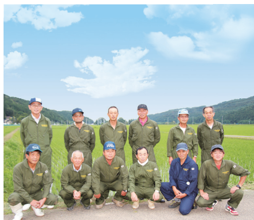
力を合わせて天栄米の栽培に取り組む会員たち

「天栄村の呼びかけで平成20年に天栄米栽培研究会が発足しました。現在は、28名の農家が一丸となって日本一おいしい米をつくることを目標に、漢方環境農法米などさまざまな栽培に取り組んでいます。会が発足した翌年、国内最大のお米のコンクールである『米・食味分析鑑定コンクール国際大会』の総合部門で金賞を受賞したんです。それまでも、自分たちの米はおいしいと思っていましたが、実際どれくらいおいしいのかわらなかつたんです。コンクールに出して初めて天栄米の実力を知りました。以来、8年連続で金賞を受賞しているんですよ。第15回大会では、5回連続で金賞を受賞している団体に