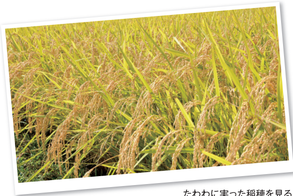
たわわに実った稲穂を見ると苦労も喜びに変わる