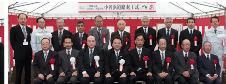
ご来賓の方との記念撮影