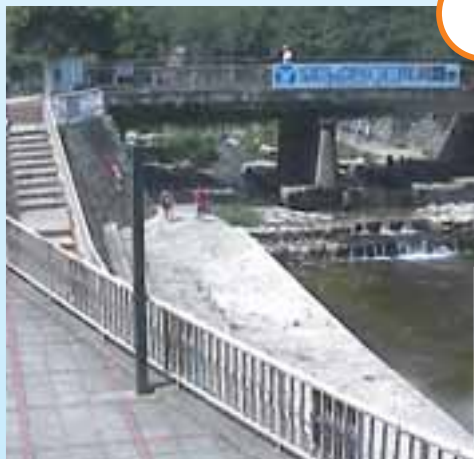
そう すい 増水直前