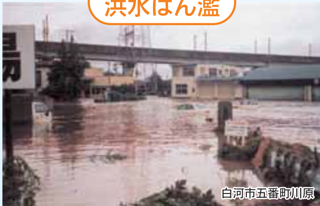
白河市五番町川原