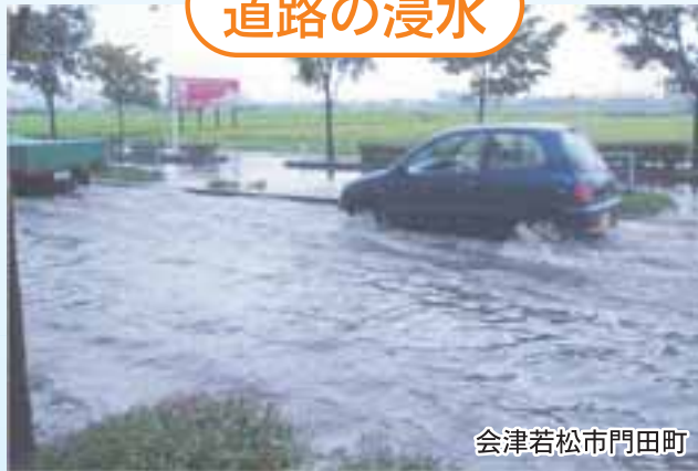
会津若松市門田町