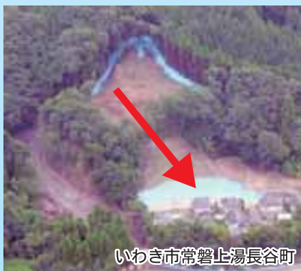
いわき市常磐上湯長谷町