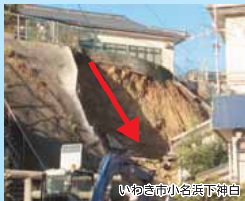
いわき市小名浜下神白