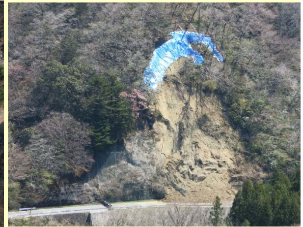
＜平成26年＞豪雨による土砂崩落