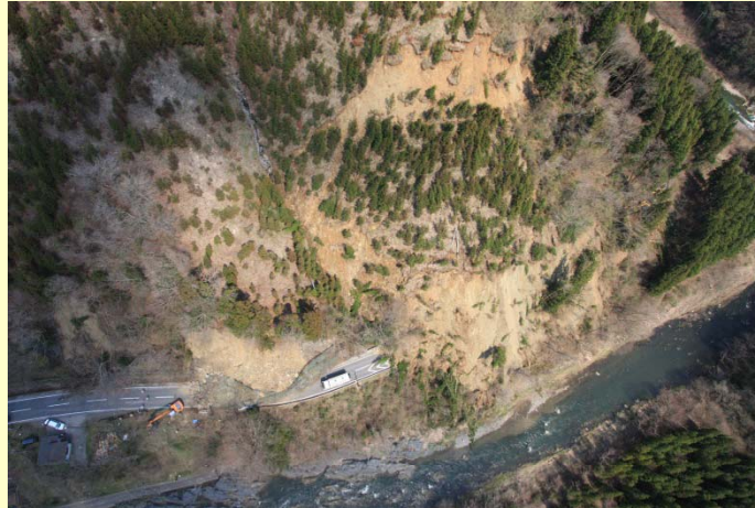
＜平成23年＞東日本大震災余震