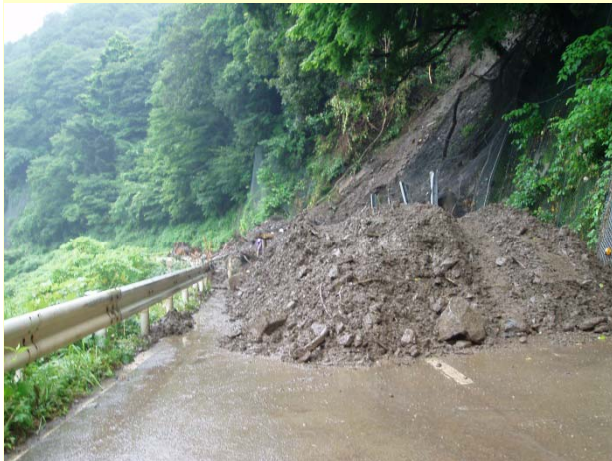
＜平成18年＞豪雨による土砂崩壊