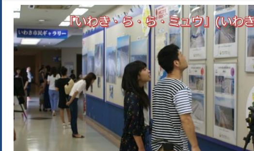
「いわき・ら・ら・ミュウ」(いわき市)