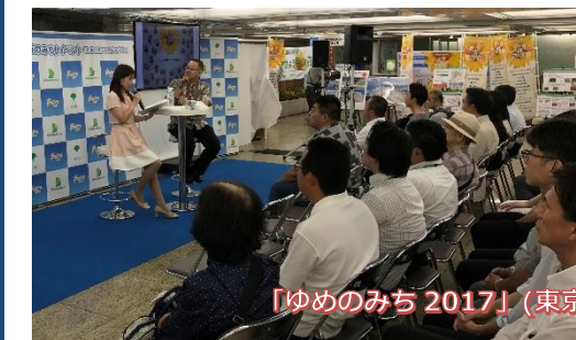
「ゆめのみち 2017」(東京都)