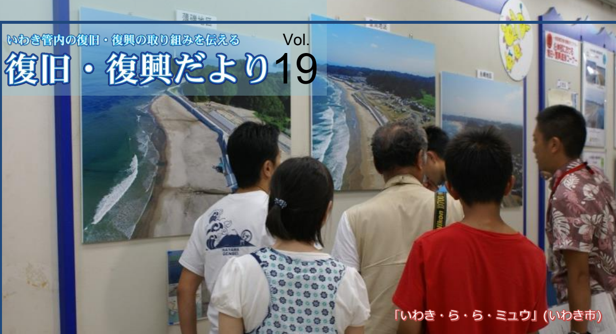
「いわき・ら・ら・ミュウ」(いわき市)

いわき沿岸部の復旧・復興が進んでいることを広く伝える「企画調査課」 みんなが安心していわきに「来る」ことができる