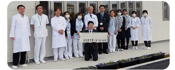
(リカーレのスタッフ)