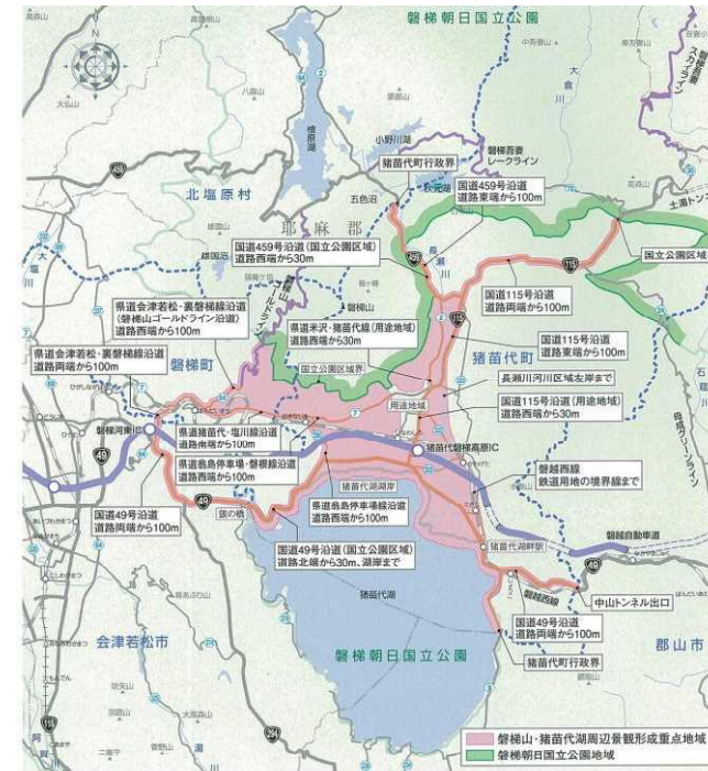
【磐梯山・猪苗代湖周辺地域景観形成重点地域】