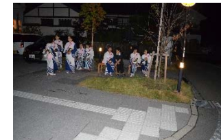
「蔵庭」でちょっと休憩