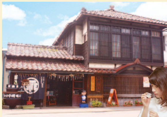
2 120年以上の歴史ある建物で、会津を代表する郷土料理のこづゆやニシンの山椒漬けなどを堪能