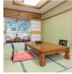
自然に囲まれ静けさの中でくつろげる山根屋旅館。