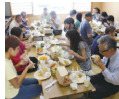
交流しながらみんなでお昼ごはん。