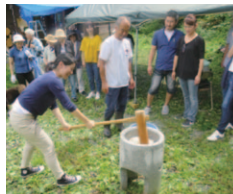
石臼と杵を使って餅つきに挑戦！