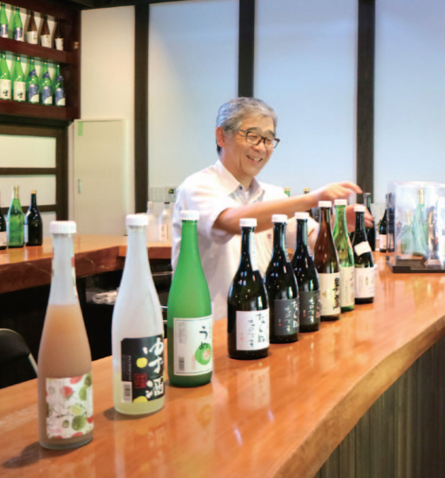
4 説明を受けながら、10種類以上のお酒を試飲可能