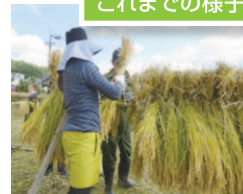
天栄米の稲穂を手作業で刈り取ります。