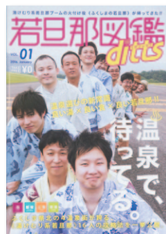
岳、飯坂、土湯、高湯の温泉街で発行した「若旦那図鑑ditt's」。