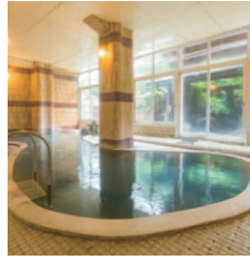
伸び伸びできる土湯温泉が誇る山根屋旅館の大浴場。