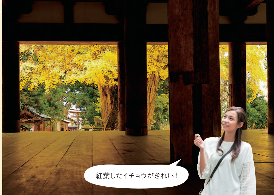
3 秋には黄金色に染まったご神木・大イチョウが長床を彩ります