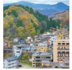
山間に旅館が立ち並ぶ土湯温泉。秋の紅葉は必見。