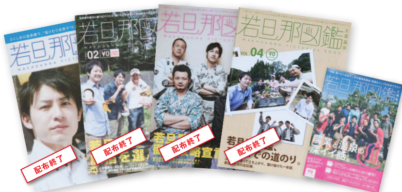
今春に発行した「若旦那図鑑」第5号は、土湯温泉観光協会と若旦那のいる土湯温泉の旅館で入手できます。

東日本大震災と福島第一原子力発電所の事故により、甚大な被害を受けた福島県。福島市の土湯温泉では、17軒あった旅館のうち6軒が休業に。そんな状況にもめげず、土湯温泉街の若旦那たちが奮闘し、発行に至った創刊号でした。その甲斐もありマスクミでたびたび取り上げられ、平成26年1月には、岳飯坂、土湯、高湯の温泉街が一つになり「若旦那図鑑ditt's」を発行。若旦那プロジェクトとして、イベントへの参加やPRを行うなど、活動は広がりを見せています。