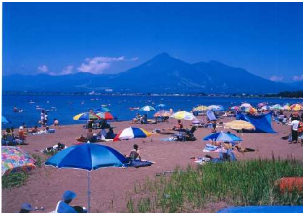
猪苗代湖から磐梯山を望む