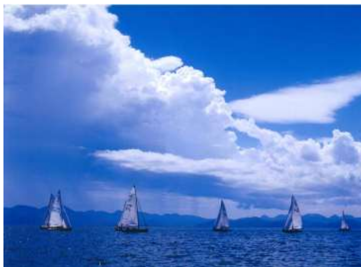
参考 附図3 土地利用方針図

また、用途地域が定められていない区域は、主に良好な居住環境を維持・保全していく区域とする。