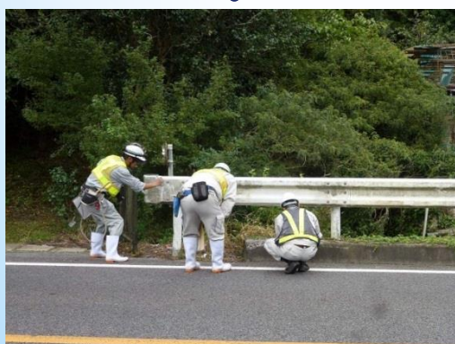
橋面の損傷確認状況