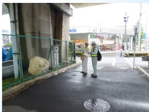
桁下からの橋脚に対する損傷確認状況