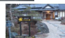
農家民宿 いちばん星