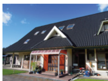
ファームハウス都路