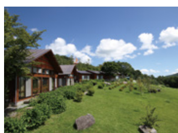
スカイパレスときわ