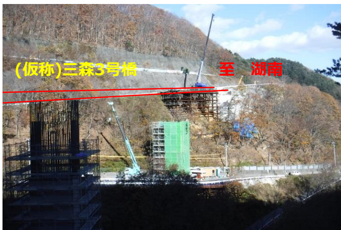
(仮称)三森3号橋 至 湖南