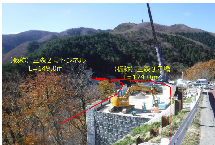
(仮称) 三森2号トンネル L=149.0m