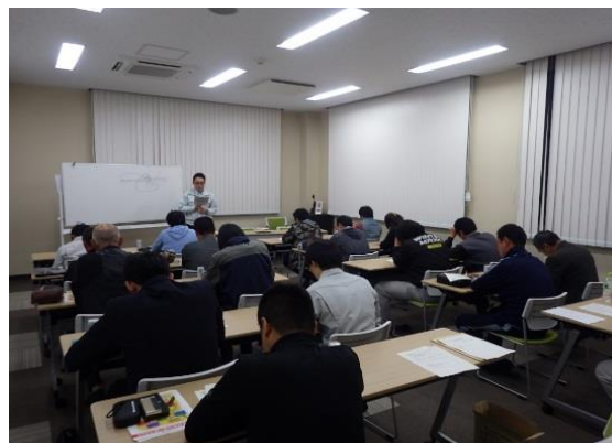
勉強会の様子（JA 夢みなみ玉川支店会議室）