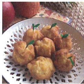
りんごのサーターアンダギー