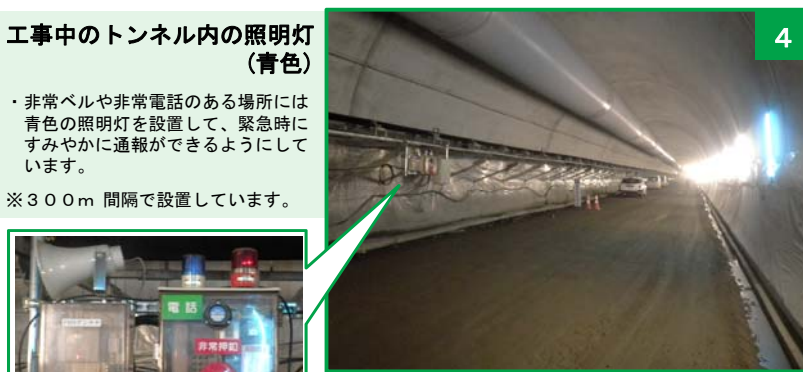
工事中のトンネル内の照明灯 (青色)

・非常ベルや非常電話のある場所には青色の照明灯を設置して、緊急時にすみやかに通報ができるようにしています。 ※300m 間隔で設置しています。