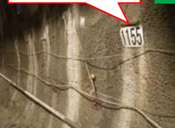
壁面には、入口からの 距離を表示しています。