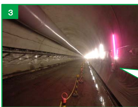
工事中のトンネル内の照明灯 (赤色)

・消火器のある場所は赤色の照明灯を設置して、トンネル内で働く全ての作業員に分かるようにしています。 ※200m 間隔で設置しています。