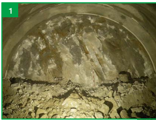
トンネル入口から 1,465m の状況