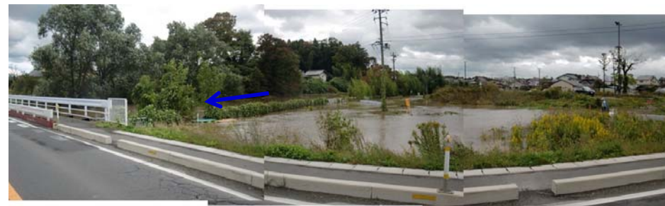
台風21号 平成29年10月撮影