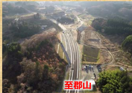
平成27年11月に1工区供用を開始しました。