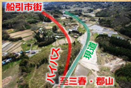
バイパス起点側から俯瞰