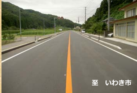
【工事完了箇所：長光地工区】