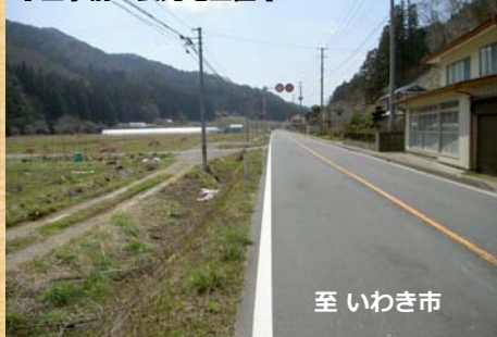
【工事前：長光地工区】