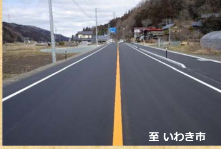
【工事完了箇所：松川工区（叶神）】