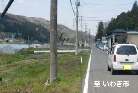
【工事前：松川工区（叶神）】