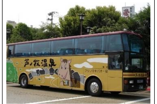
アシノマキバオー号

芦ノ牧温泉と東山温泉が連携し、宿泊者の観光の利便性を向上させるために、周辺の観光地を周遊するバス「アシノマキバオー号」を運行しています。