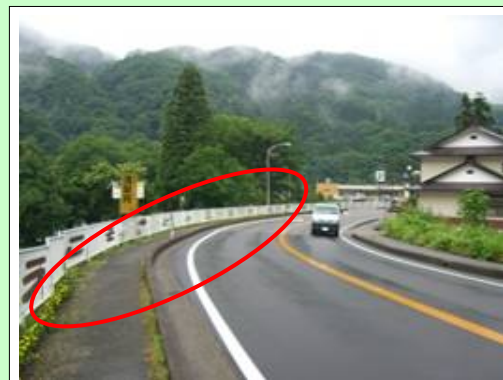
芦ノ牧橋の美化活動

・ 芦ノ牧温泉観光協会、県、会津若松市の三者で「うつくしま道・サポート」制度を締結し、「芦ノ牧温泉ポケットパーク」内の花壇への花植えのほか、芦ノ牧橋も含めた周辺の清掃活動を毎月定期的に行っています。