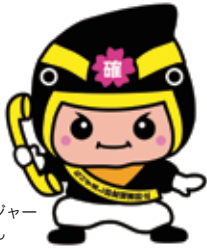
カクニンジャー 福くん