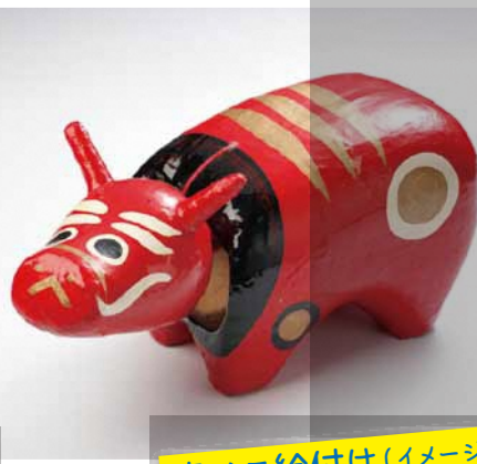
赤べこ絵付け(イメージ)