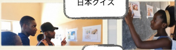
にほんクイズ 日本クイズ