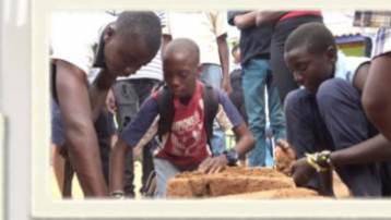
ゆかた きつ 浴衣の着付け