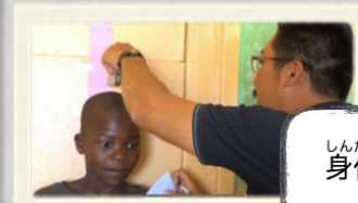
しんたいそくてい 身体測定