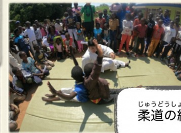
じゅうどうしょうかい 柔道の紹介