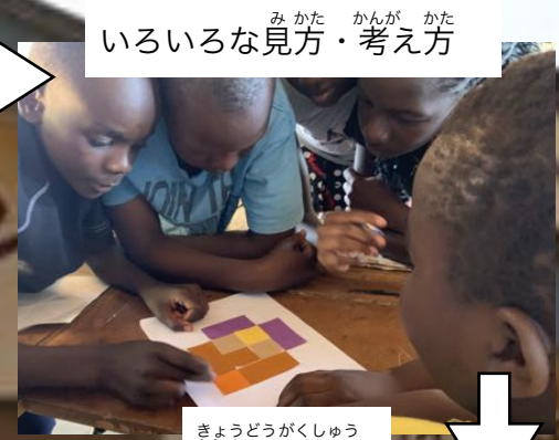
いろいろな見方・考え方