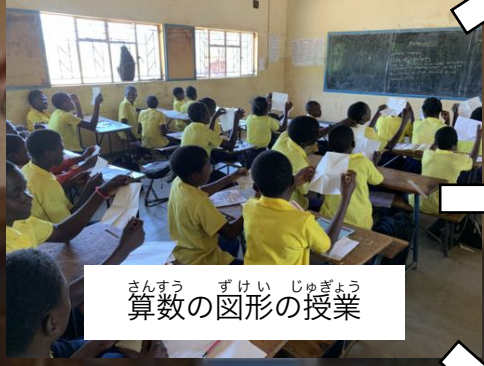
さんすう 算数の図形の授業