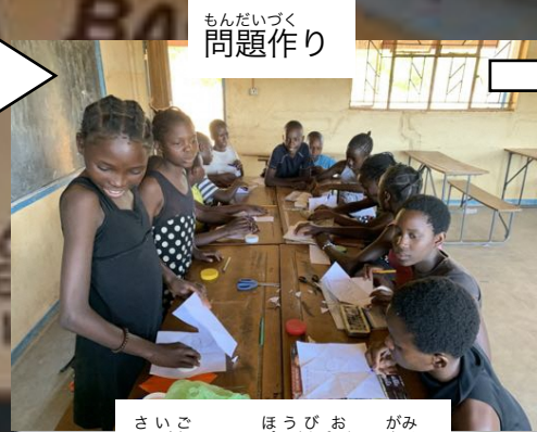
もんだいづく 問題作り