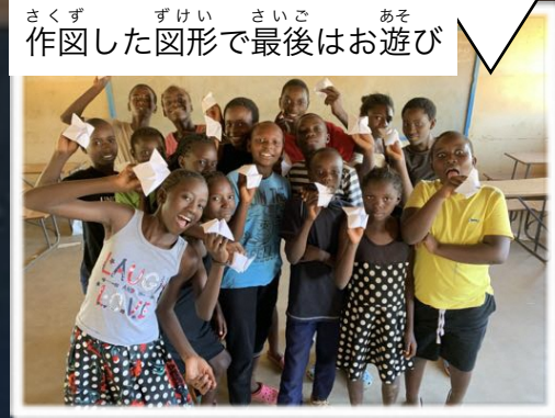
さくず 作図した図形で最後はお遊び