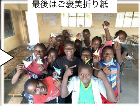
さいご 最後はご褒美折り紙