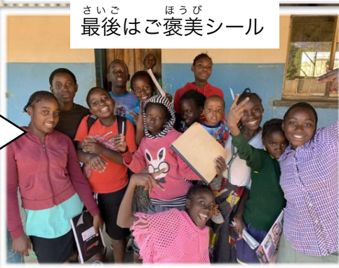
さいご 最後はご褒美シール