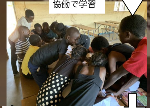
きょうどうがくしゅう 協働で学習

授業の中で積極的に尋ねる姿が見られたり、算数の問題を家族に出題したりする様子が見られるようになりました。試験合格できますように…。