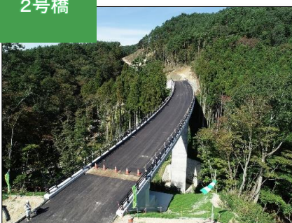
完成した内倉湿原2号橋。